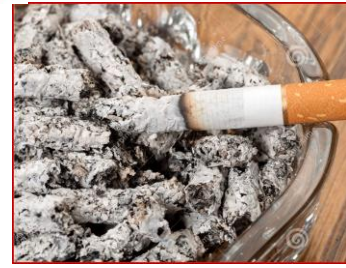
Ceneri (p. es. cenere delle sigarette o delle cicce, cenere per carbone e bricchette)