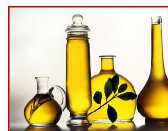
Oli e grassi

„Oli“ per pers. private (centro riciclag);