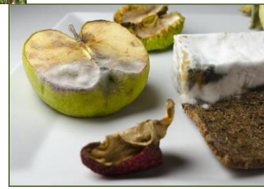
Generi alimentari avariati (senza imballaggi)