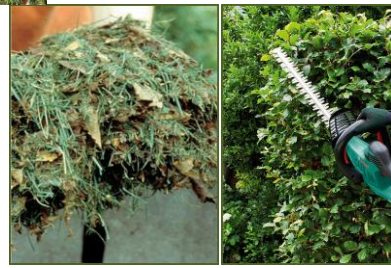
il taglio dell'erba, foglie ed erbacce, il taglio degli arbusti, delle siepi e degli alberi