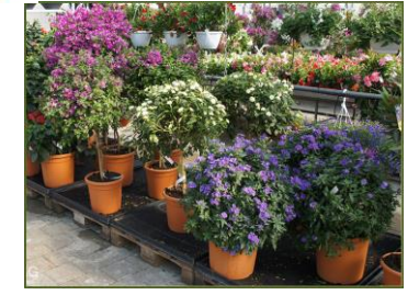
Fiori recisi, piante in vaso incl. la terra (in piccole quantità)