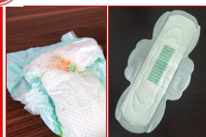
Pannolini monouso e prodotti per l'igiene (p. es. bende, bastoncini nettaorecchi...)

„Oli“ per pers. private (centro riciclag);