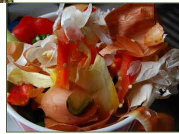
Bucce e avanzi di frutta, verdura e insalata