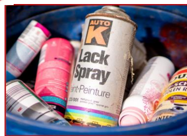
inquinanti di ogni tipo (batterie, resti di colore, medicinali, vernici, bombolette ecc.)

Usate i sacchetti di carta appropriata o la carta di giornale (niente carta lucida) per la preselezione a casa. NOVITÀ: I sacchetti adatti per i rifiuti biologici saranno distribuiti gratuitamente su richiesta da novembre 2021 presso l'ufficio del centro di riciclaggio.