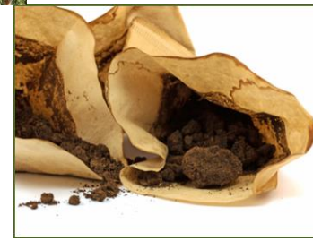
Fondi di caffè compreso i sacchi filtranti (senza capsule e altri imballaggi), bustine di tè