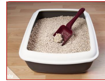
lettieria ed escrementi (dai cani ed altri animali)