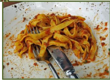
Scarti di alimenti ed avanzi di pietanze (carne, pesce e prodotti lattiero-caseari)