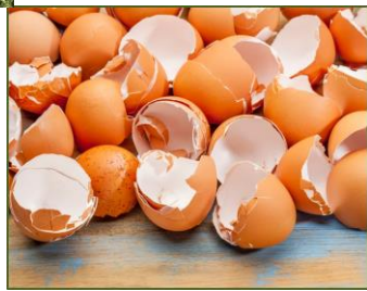
Gusci delle uova