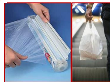
materiali sintetici di tutto tipo (cellofan, sacchetti di nylon, bioplastica, coppa da yogurt, imballaggi di materiali misti, ...)