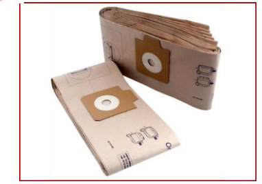
Pattume, sacchetti per l'aspirapolvere