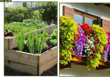
Rifiuti del giardino e rifiuti verdi, fiori da balcone e da giardino