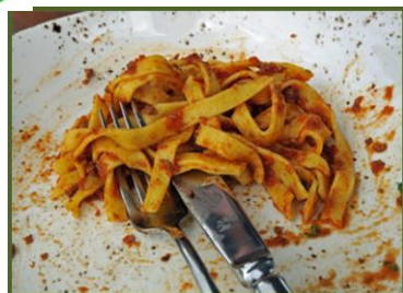
Lebensmittel- und Speisereste (inkl. Fleisch, Fisch, Milchprodukte)