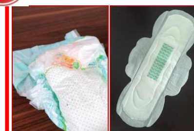
Wegwerfwindeln, Hygieneartikel (z.B. Binden, Wattestäbchen...)