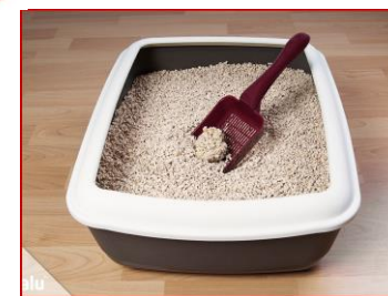
Kleintier- und Katzenstreu bzw. Kot (auch von Hunden)