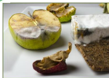
Verdorbene Lebensmittel (ohne Verpackung)