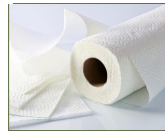
Küchenpapier und Servietten (in geringen Mengen)