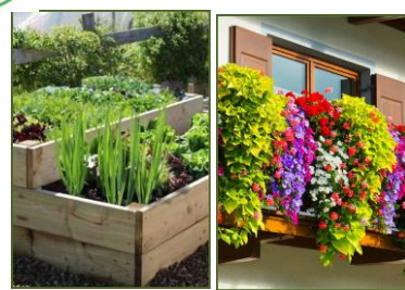
Garten- und Grünabfälle Balkon- und Gartenblumen