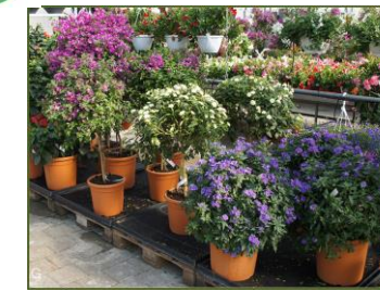
Schnittblumen, Topfpflanzen inkl. Erde (in geringen Mengen)