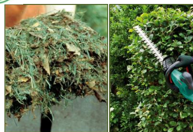
Rasenschnitt, Laub, Unkraut Strauch-, Hecken- und Baumschnitt