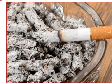
Asche (z.B. Zigarettenasche bzw. –kippen, Kohlen- und Brikettasche)