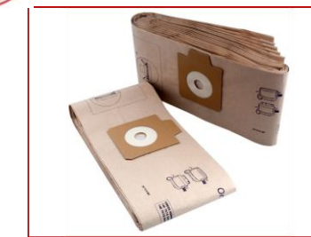
Kehricht, Staubsaugerbeutel Wursthaut