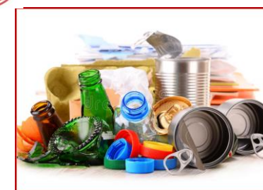
Glas, Metalle, Papier