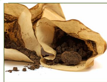
Kaffeesatz samt Filter (keine Kapseln und sonstige Verpackungen), Teebeutel