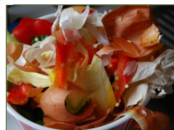
Schalen und Reste von Obst, Gemüse und Salat