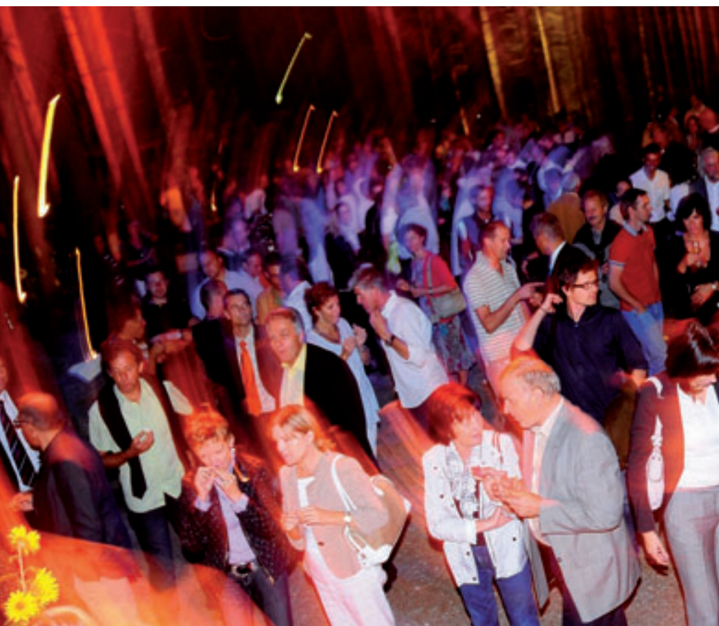
Festa: la migliore atmosfera possibile per il tema "Cascade e l'economia pusterese"

IL PROGETTO BALNEARE "CASCADE" È STATO PRESENTATO AL SETTORE ECONOMICO