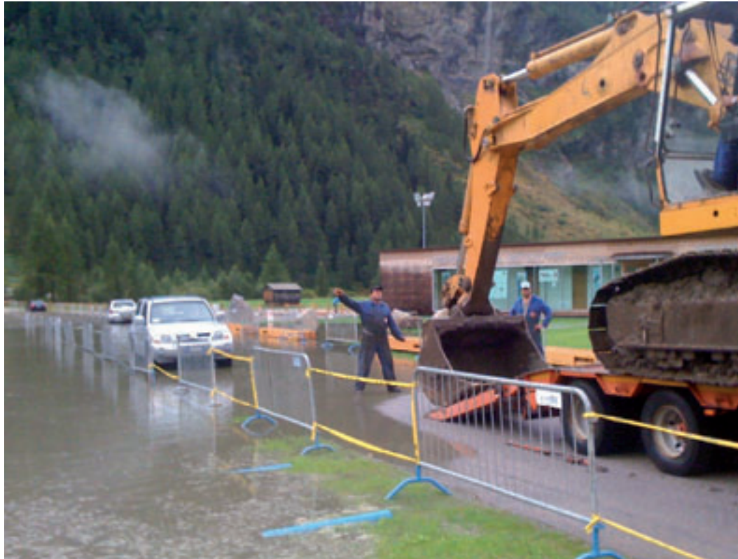
Attrezzatura pesante: ecco il nuovo parcheggio di Riva completamente allagato