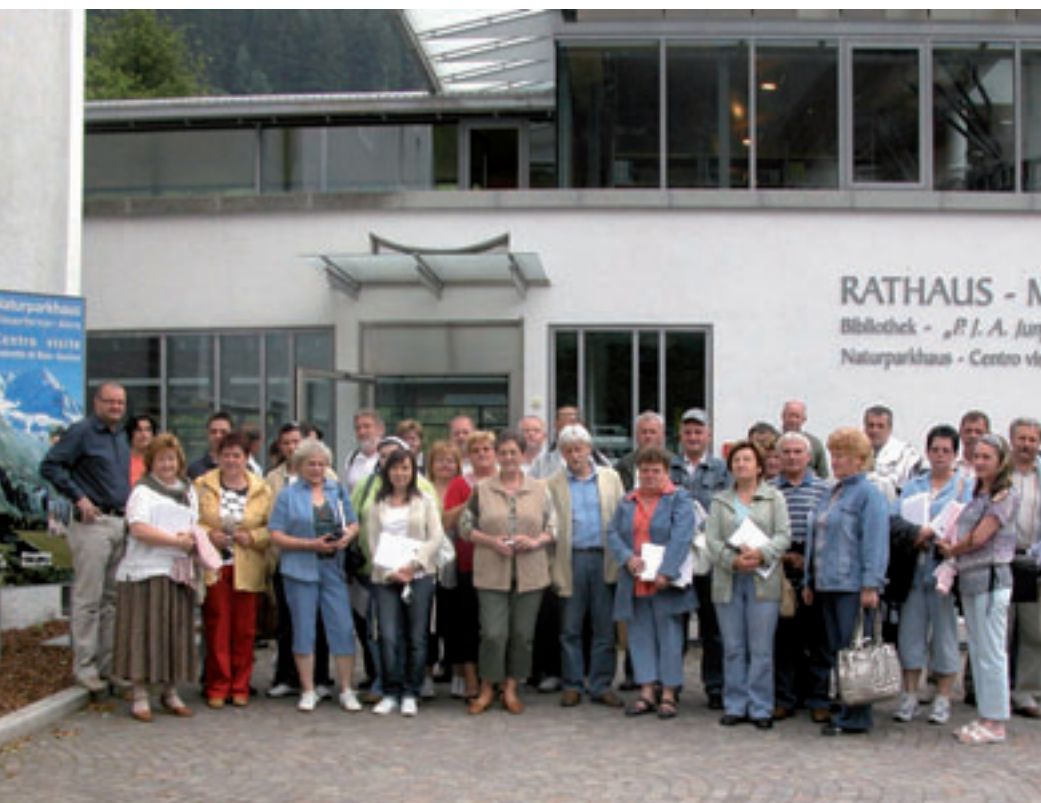
Come ospiti a Campo Tures: sempre più spesso molti gruppi visitano il paese dell'energia

IL PREMIO EUROPEO PER IL RINNOVO PAESANO RAVVIVA IL TURISMO E L'ECONOMIA