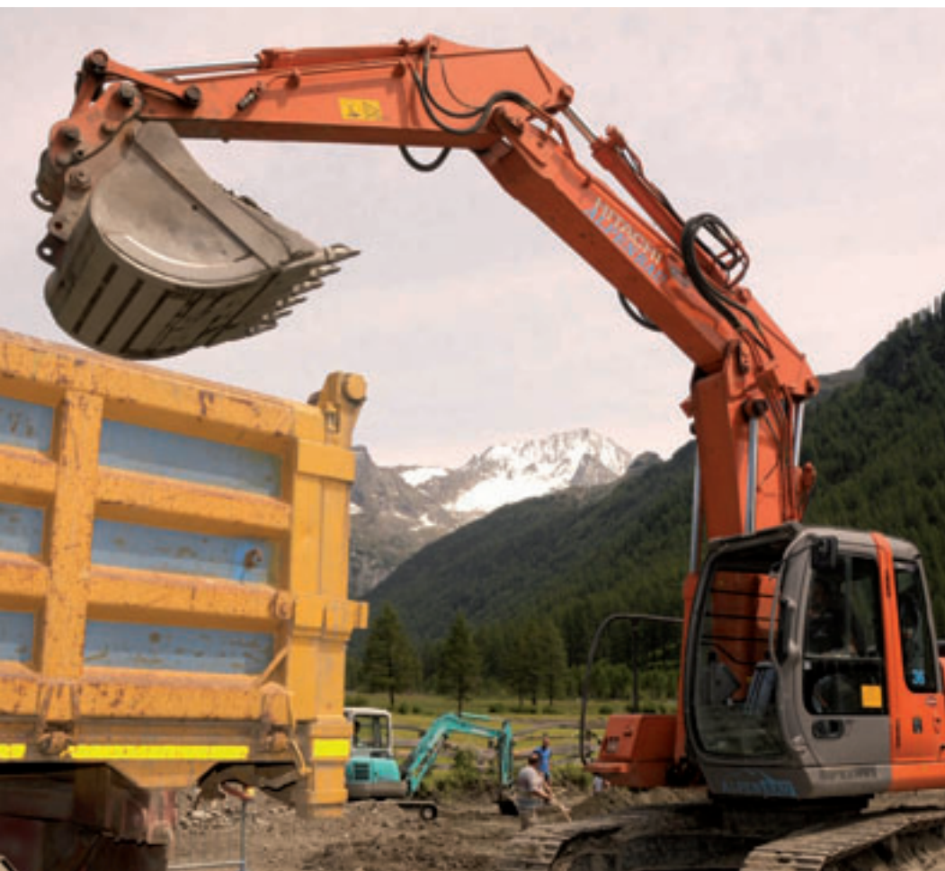
Scavi: cantiere a Riva ai piedi del Coll'alto

RIVA OTTIENE UN PARCHEGGIO E UNA NUOVA CANALIZZAZIONE