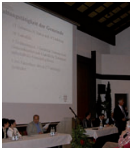
Assemblea dei cittadini

S: L'amministrazione comunale ha dato il consenso al piano di applicazione per la zona residenziale "Sull'Aurino" affrontando molte difficoltà: le quote prefissate, ad esempio, hanno creato