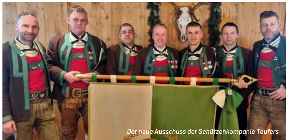
Der neue Ausschuss der Schützenkompanie Taufers