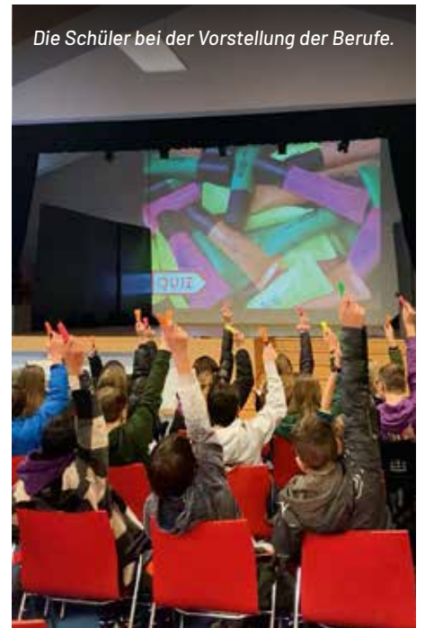
Die Schüler bei der Vorstellung der Berufe.

Begeistert waren die Schüler vor allem über die Berufsinformationsseite myway.bz.it. Das auf der Seite integrierte Berufsprofil, eine Stärken- und Schwächenanalyse, hilft den Jugendlichen, den richtigen Beruf für sich selbst zu finden. Kurzfilme über die vielfältigen Berufe geben einen Einblick in die Arbeitswelt und helfen bei der Berufsorientierung. Egal, ob Verkäuferin, Konditor, Mediendesignerin oder Einrichtungsberater: Der hds gibt einen Überblick über diese und weitere 9 Fachberufe sowie über die dafür notwendigen Voraussetzungen.