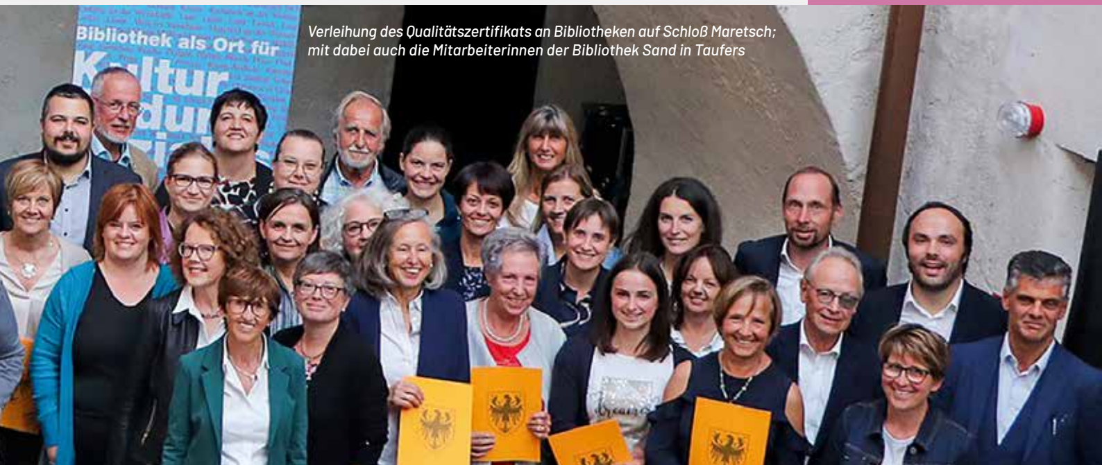
Verleihung des Qualitätszertifikats an Bibliotheken auf Schloß Maresch; mit dabei auch die Mitarbeiterinnen der Bibliothek Sand in Taufers