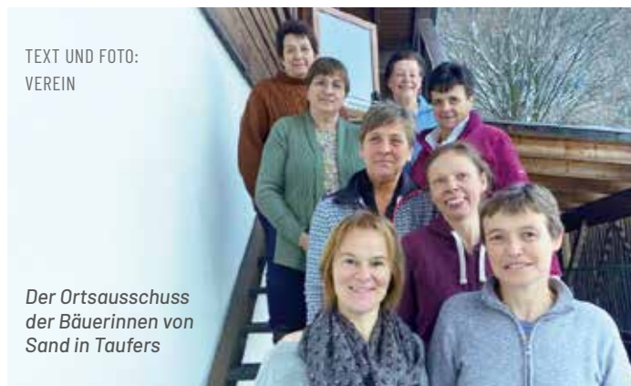
TEXT UND FOTO: VEREIN

Die Bäuerinnen von Sand in Taufers blicken auf zahlreiche Tätigkeiten zurück. Auch die Neuwahl des Ortsausschusses stand bevor.