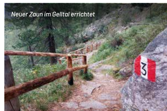
Neuer Zaun im Gelltal errichtet

Die Gesamtausgaben des Naturparks belaufen sich somit auf ca. 636.500 €. Ein großer Dank gebührt den vielen Partnern, Leihgebern und Förderern sowie all jenen, die sich während des Jahres in irgendeiner Weise für den Naturpark eingesetzt haben.