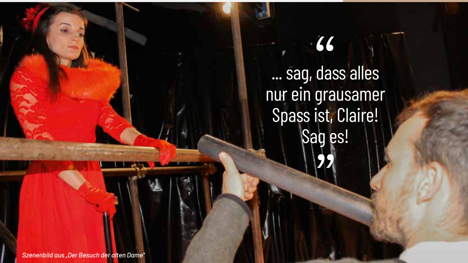
Szenenbild aus „Der Besuch der alten Dame“

“ ... sag, dass alles nur ein grausamer Spass ist, Claire! Sag es! ”