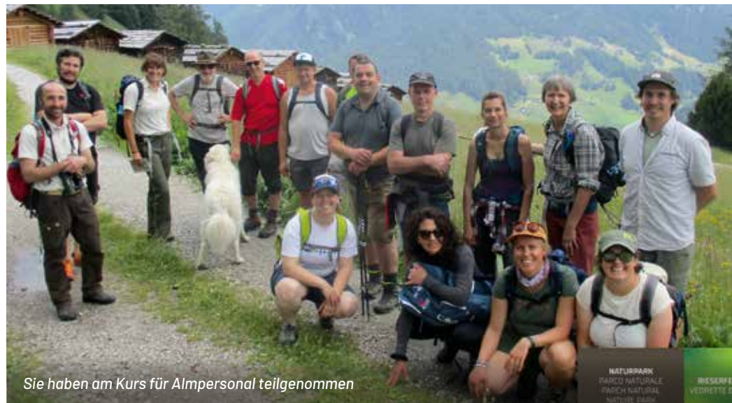
Sie haben am Kurs für Almpersonal teilgenommen