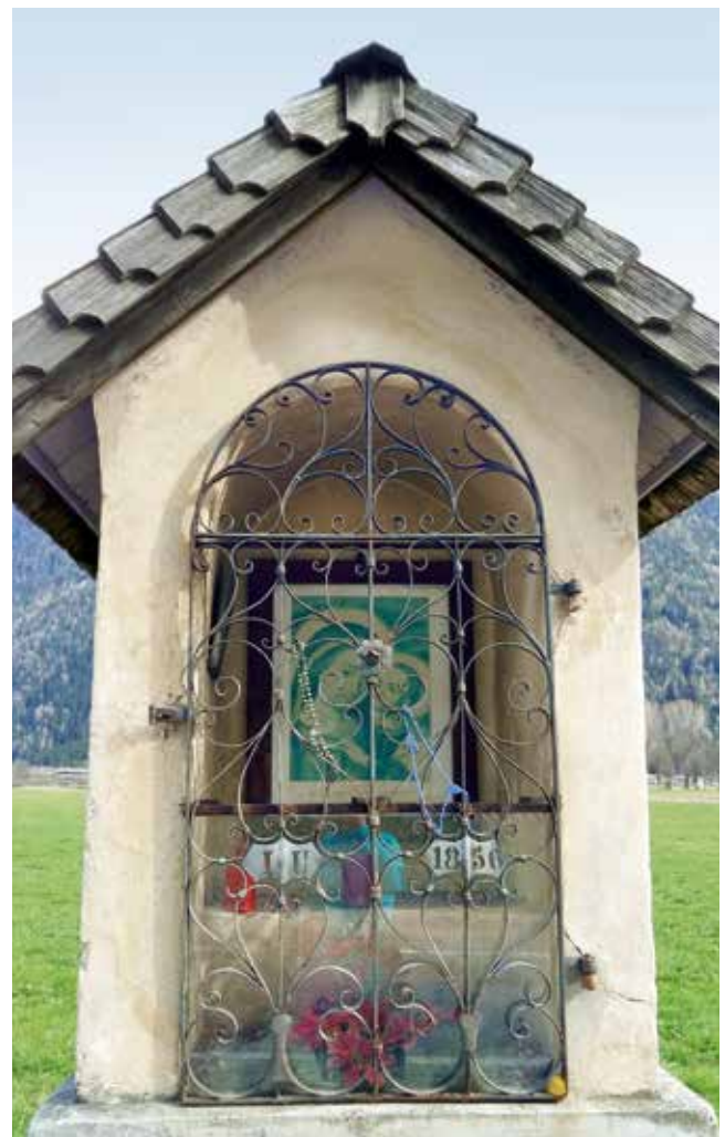
Bildstöckl aus dem Jahr 1856 an der Ahrntalerstraße, Bereich Pfarre