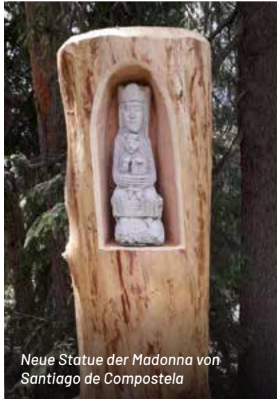
Neue Statue der Madonna von Santiago de Compostela

Franziskusweg ein großes Anliegen, die Franz-und-Klara-Kapelle mit besinnlichen Feiern zu beleben. So wurden in der ersten Woche im August die 4 Portiunkulatlage mit Andachten gefeiert. Am 11. August, dem Tag der Hl. Klara, fand abends eine hl. Messe statt, die auch von Radio Maria übertragen wurde. Besonders festlich wird es immer am Franziskustag am ersten Sonntag im Oktober: Viele Pilger begehen den Weg hinauf zur Kapelle, wo eine feierliche Andacht abgehalten wird; im letzten Jahr gestaltet durch Diakon Günther Rederlechner und musikalisch umrahmt von der Singgruppe Coram aus Bruneck. Ebenfalls im Oktober hielt man